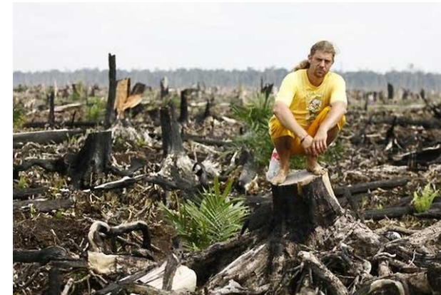
Palmöl vernichtet Regenwald

03. und 04. Dezember 2010 Schloss Beuggen, Rheinfelden/Baden